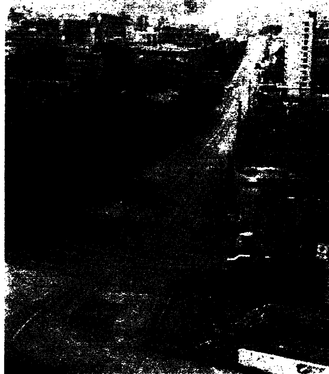
■ هريس في بناصة بمنطقة الشياح

بيروت لم تهدأ ولم تنعم . تلاصصا والتذالك لا تفرق بين ليل ونهار . وتكاد سماء العاصمة لا تخار في اية لحظة من رسامس او ثقبة . وكما بيروت ، كذلك الناس .. لا راحة في الليل والنهار . والقسمة المشتركة بين الجميع هو الربيع والقلق وعدم النوم .